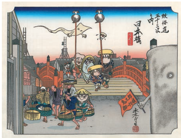
「妖怪道五十三次 日本橋」