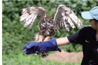
2年・中村 咲希 「飛翔」