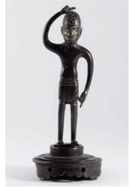
誕生釈迦仏立像 (高麗時代) 総高 14.0cm