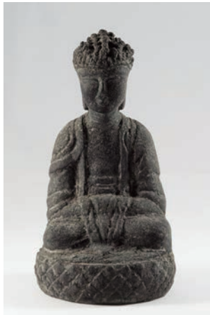
如来坐像 (高麗時代) 総高 15.7cm