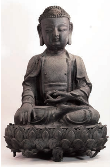
如来坐像 (中国明時代) 総高 30.6cm