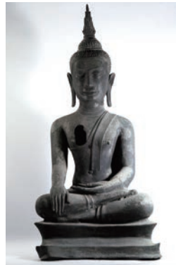
仏陀坐像 (タイアユタヤ朝時代) 総高 55.3cm