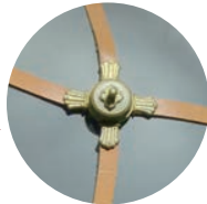
宝珠貝飾付辻金具