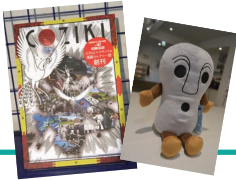
左：「COZIKI (コジキ) プロジェクト」商品 右：「IKITAKE (イキテイク)」商品