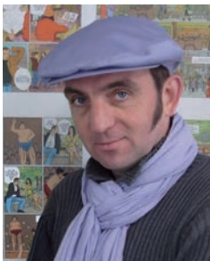
ヴァンサン・ルフランソワ

期間：11月10日(土)～11月25日(日) 場所：一支国博物館 3 階 多目的交流室 アーティスト：ヴァンサン・ルフランソワ (フランス/バンド・デシネ作家)、 トニー・マナン(フランス/バンド・デシネ作家) 入場料：無料