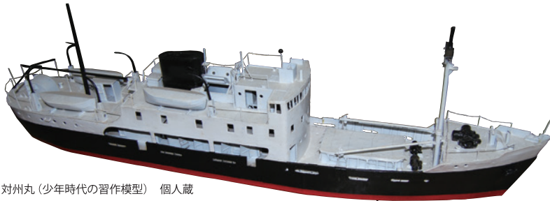
対州丸（少年時代の習作模型） 個人蔵