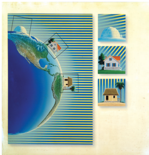
SUNBEAM ANGLES / National Geographic Picture Atlas of Our World 長崎県立壱岐高等学校 所蔵