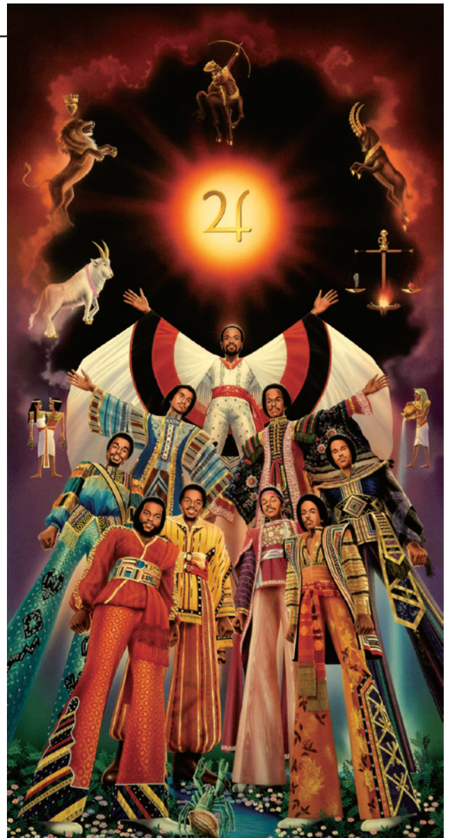
黙示録 / アース・ウィンド & ファイア [1979]