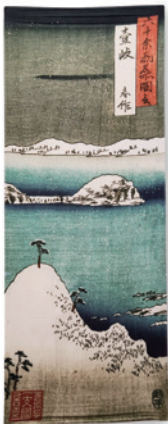
④ 手ぬぐい ¥1,300 税込