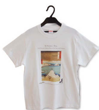
② Tシャツ ホワイト (サイズレンジ：レディース S-M-L、メンズ S-M-L-XL) ¥2,500 税込