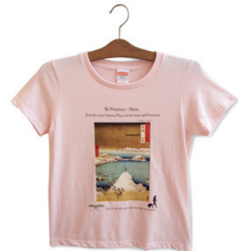
③ Tシャツ ベビーピンク (サイズレンジ：レディース S-M-L) ¥2,500 税込