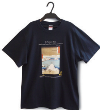
① Tシャツ ダークネイビー (サイズレンジ：メンズ S-M-L-XL) ¥2,500 税込

ご多忙の折、お手数をお掛けしますが、関係各位へご周知方、よろしくお願い申し上げます。