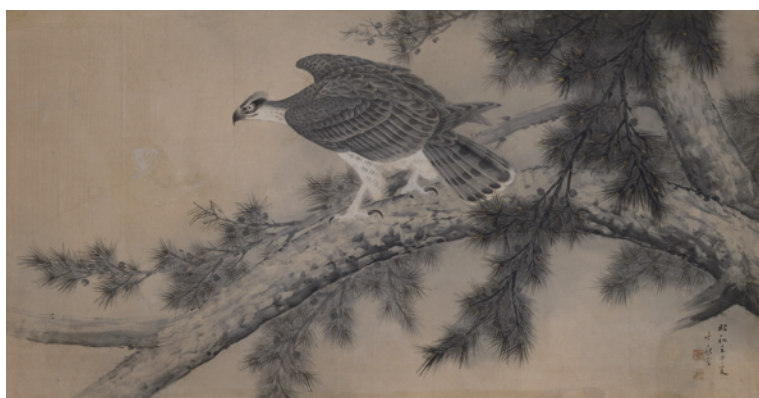
荒木十畝《松樹白鷹の図》1932年